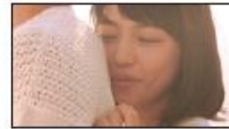
(川口さん) ゴキュン。