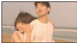
(川口さん) ゴキュン。