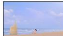
ヤクルトの乳性飲料 ミルージュ