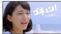
(川口さんオフナレ) と、うまい！