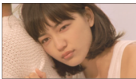
(川口さん) ゴキュン。