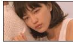
(川口さん) ゴキュン。