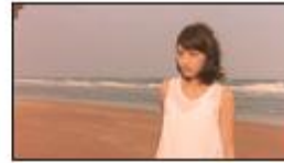
(川口さん) ゴキュン。