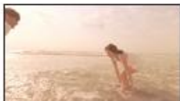
(川口さん) ゴキューーン！