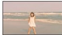
(川口さん) ゴキューーン！