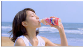
(川口さんオフナレ) ヤクルトのミルージュは、 ゴクッ、ゴクッ