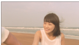
(川口さん) ゴキュン。