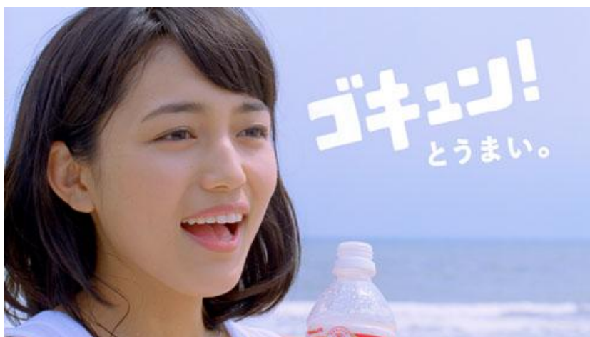
テレビCM【ミルージュ ゴクゴク、ゴキュン！】篇