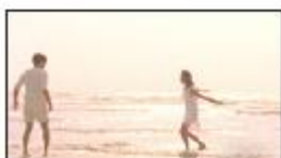
(川口さん) ゴキューーン！