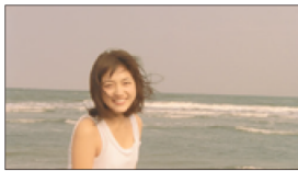
(川口さん) ゴキュン！