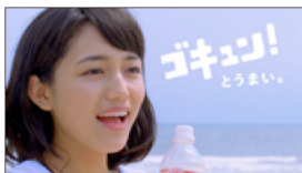
(川口さんオフナレ) と、うまい！