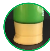
チューブキャップ ひっかかり