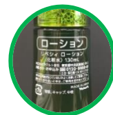
アイテム名 拡大表示