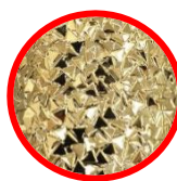
キャップ 内面彫刻