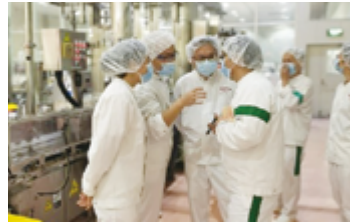
食品安全自主検査の様子

中国では、「安全・安心」でおいしい製品を消費者に提供するため、食品安全法の規定に基づき、定期的に食品安全自主検査を実施しています。2022年度は、上海工場で9月に実施しました。新型コロナウイルス感染症の影響による出張制限のため、天津工場、無錫工場での検査は実施を見送りました。