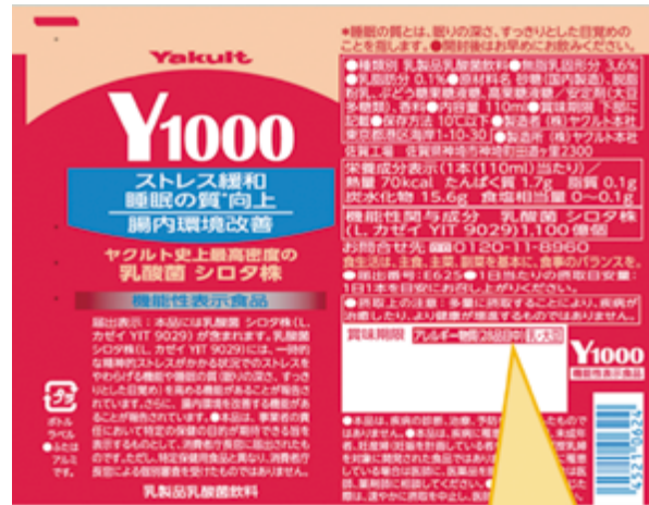
アレルギー物質(28品目中)の記載例