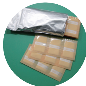
乳酸菌 シロタ株生菌製剤

シロタ株を含む)ずつ、1年間またはがんが再発するまで飲んでもらいました。なお、本試験に協力してくれた被験者の中には、はじめて表在性膀胱がんになった人、再発した人、複数のがんがあった人などがいましたが、悪性度や再発の危険性は個人間で異なります。そこで、被験者の背景の違いによるサブグループ(サブグループA:初発でかつ多発がん、サブグループB:再発しかつ単発がん、サブグループC:再発しかつ多発がん)を作り、その中で乳酸菌 シロタ株生菌製剤服用群、プラセボ服用群に分けて試験を行いました。