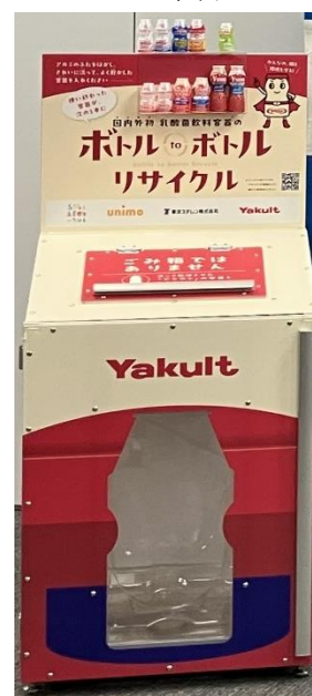
回収用専用ボックス