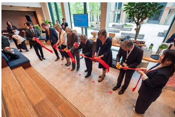
&lt;テープカットの様子&gt;