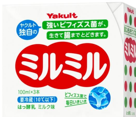
背面のCMキャラクターのコメント（例）