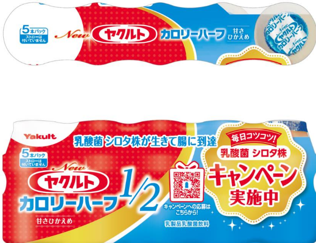
「New ヤクルトカロリーハーフ」5本パック