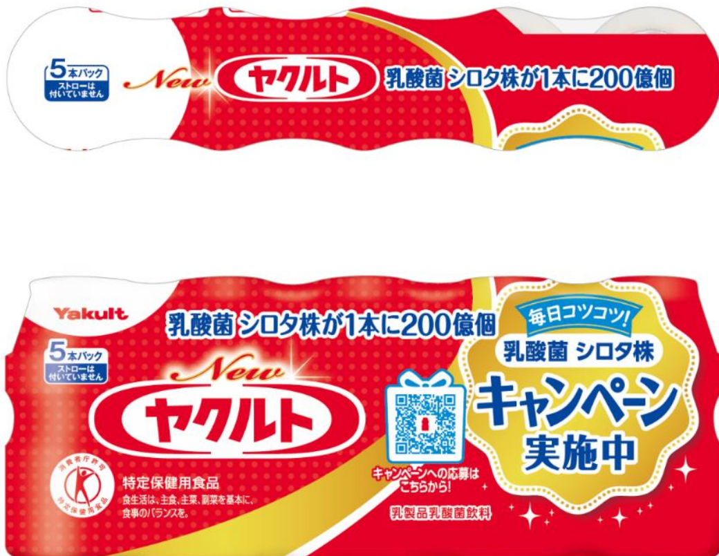
「New ヤクルト」 5本パック